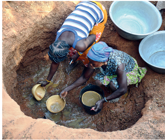
Dorffrauen suchen in Wassertümpeln nach Wasser.