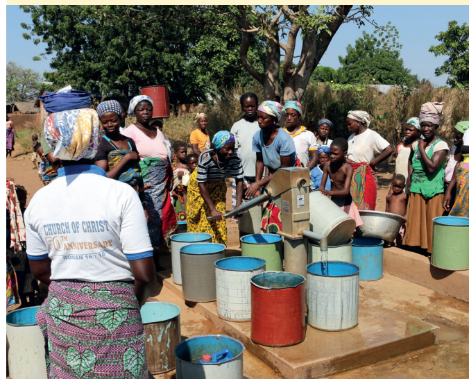
Sauberes Trinkwasser für alle Dorfbewohner in Yendi / Ghana.