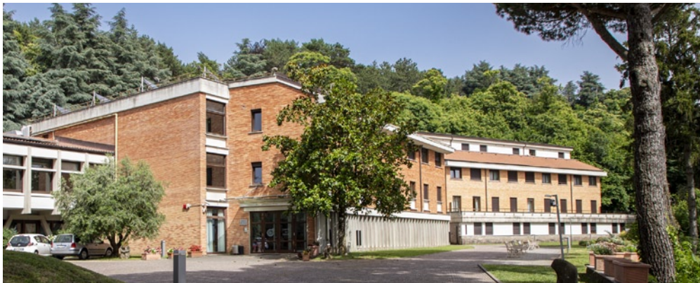
Centro Ad Gentes in Nemi

- Programmänderungen aus wichtigem Grund (z. B. Absage der Generalaudienz) vorbehalten. -