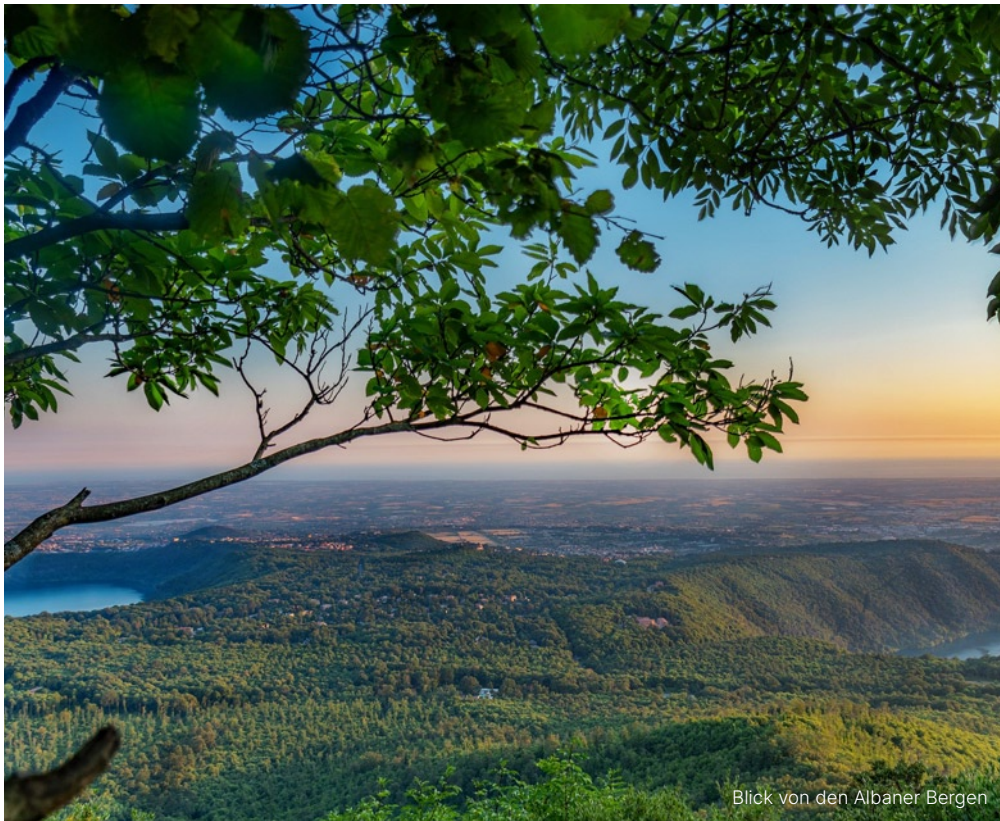
Blick von den Albaner Bergen